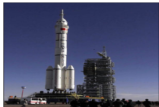
“神舟”二号飞船于 2001 年 1 月 10 日发射，在轨飞行 7 天后成功返回地面。