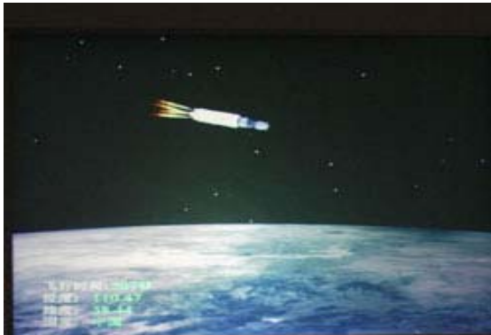
“神舟”四号飞船于2002年12月30日发射，于1月5日准确着陆。