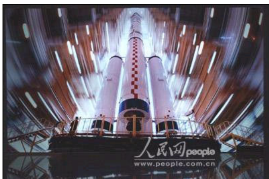
“神舟”一号飞船于 1999 年 11 月 20 日发射，飞船返回舱于次日成功着陆。

利用以下提供的图片资料，图片资料素材以文件形式存放在“神舟素材”文件夹中。用 PowerPoint 创意制作“神舟飞船大记事（中国百年飞天梦）”演示文稿，直接用 PowerPoint 的保存功能存盘。（15 分）