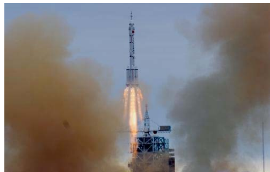
神舟六号于2005年10月12日发射，10月17日飞船返回舱成功着陆。