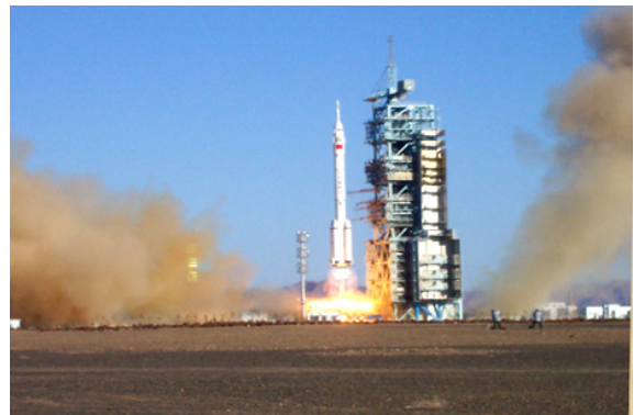
“神舟”五号第一艘载人飞船于2003年10月15日发射，16日成功着陆。