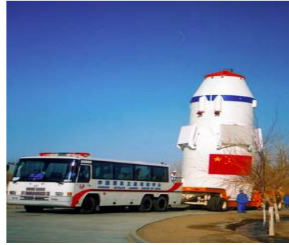
“神舟”三号飞船于2002年3月25日发射，“神舟”三号轨道舱在太空留轨运行180多天