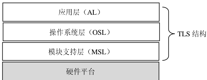
图 3-1 宇航嵌入式设备软件架构

公司在接到此项任务后，进行了反复论证，提出三层栈（TLS）软件总体架构，如图 3-1 所示，并将软件设计工作交给了李工，要求其在三周内完成软件总体设计工作，给出总体设计方案。